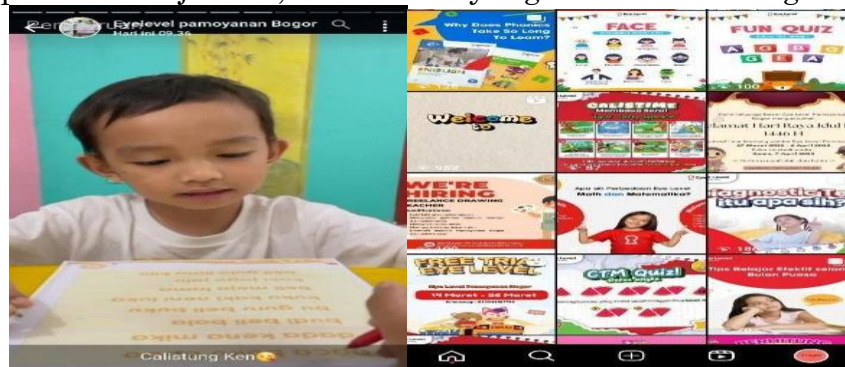
Gambar 4. Tangkapan Layar Konten WhatsApp (Kiri) dan Instagram (Kanan) Hasil Wawancara

Konten yang dibagikan melalui WhatsApp umumnya berbentuk teks, gambar, atau video yang memuat informasi teknis serta dokumentasi pembelajaran anak di kelas. Sementara itu, Instagram lebih menonjolkan visual seperti video pembelajaran singkat, kuis, pembaruan jadwal, serta event yang akan mendatang.