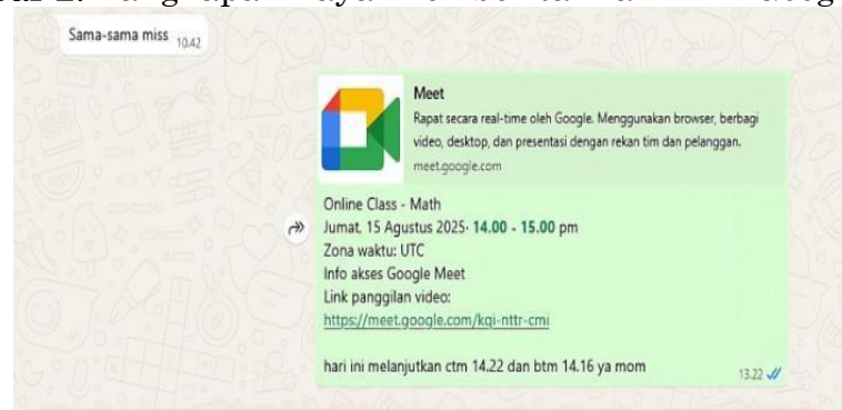
Gambar 3. Tangkapan Layar Pemberitahuan Terdapat Siswa Yang Sedang Berkabung

Konten yang dibagikan melalui WhatsApp umumnya berbentuk teks, gambar, atau video yang memuat informasi teknis serta dokumentasi pembelajaran anak di kelas. Sementara itu, Instagram lebih menonjolkan visual seperti video pembelajaran singkat, kuis, pembaruan jadwal, serta event yang akan mendatang.