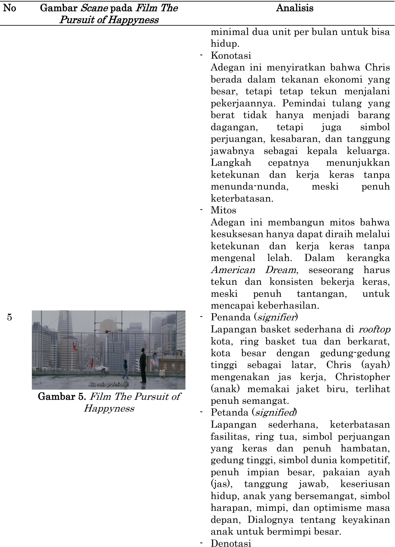
Gambar 5. Film The Pursuit of Happiness