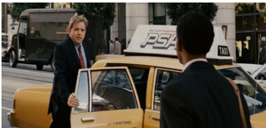
Gambar 2. Film The Pursuit of Happiness