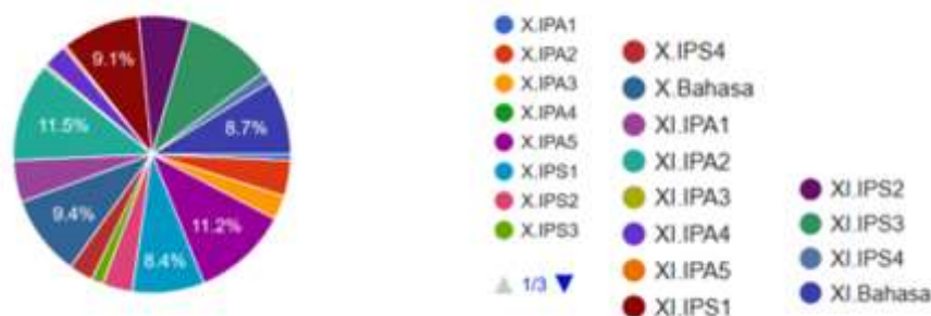
Gambar 1. Persebaran Responden penelitian per kelas

Responden dalam penelitian ini sebanyak 286 orang diambil dari masing-masing kelas, yaitu kelas X IPA5 dan XI IPA2 sebanyak 32 responden, selanjutnya X.Bahasa sebanyak 27 responden, XI IPS1 sebanyak 26 responden, dan XI Bahasa sebanyak 25 responden. Untuk responden paling sedikit yaitu kelas X IPS1 sebanyak 24 responden. Sedangkan untuk responden lainnya yaitu merupakan gabungan dari semua kelas kecuali kelas yang sudah ada di data tersebut sebanyak 119 responden. Berikut adalah grafik kelas: