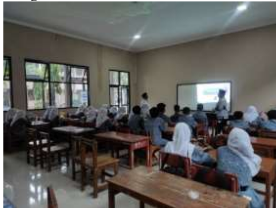
Gambar 3. Tayangan visual cara operasional aplikasi canva.com

materi. Keseluruhan, perencanaan dan pelaksanaan kegiatan PTK ini mencerminkan keterlibatan aktif guru dan siswa dalam menggunakan media pembelajaran serta memberikan ruang bagi kolaborasi dan diskusi, yang diharapkan dapat meningkatkan hasil belajar siswa secara signifikan.