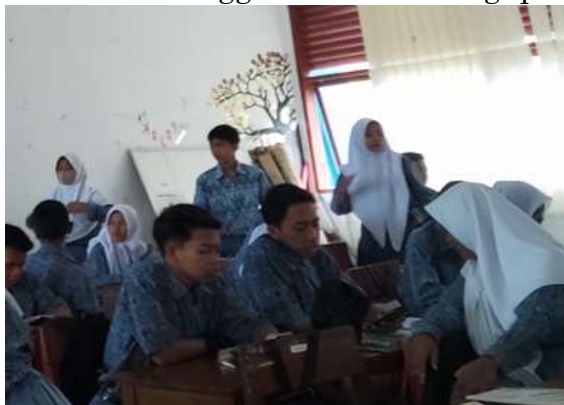
Gambar 5. Siswa antusias dalam proses pembelajaran menyelesaikan penugasan

Sedangkan pada tahap pengamatan ( observation ), peneliti sebagai guru mata pelajaran dibantu kolaborator mengamati jalannya proses pembelajaran sosiologi sesuai dengan rencana yang telah dibuat. Pengamatan ini melibatkan pemantauan terhadap interaksi antara guru, siswa, dan materi pembelajaran, serta evaluasi terhadap efektivitas perbaikan dan penyesuaian yang telah dilakukan pada siklus 2. Maka Siklus 2 ini tidak hanya memperbaiki kelemahan yang teridentifikasi pada siklus sebelumnya, tetapi juga mengeksplorasi pendekatan kolaboratif antar siswa untuk meningkatkan pemahaman dan penguasaan materi pembelajaran, sekaligus merangsang kreativitas siswa dalam menggunakan teknologi pembelajaran.