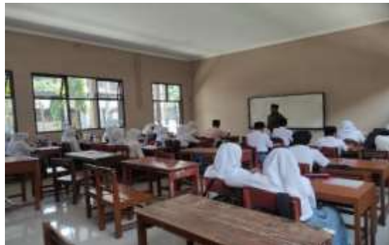
Gambar 2. Situasi pembelajaran dengan kondisi awal sebelum tindakan

Pelaksanaan untuk mengukur kemampuan awal siswa dilaksanakan pada hari Selasa, tanggal 9 Mei 2023 diawali pengajaran yang dilakukan di kelas XI Bahasa untuk materi pengertian dan sebab-sebab terjadinya konflik sosial dengan menggunakan metode ceramah serta penugasan model klasik yaitu mengerjakan LKS tulis dengan berbagai pertanyaan soal. Pada pembelajaran ini observer mengamati kejadian-kejadian yang terjadi secara rinci pada saat guru memaparkan materi tersebut: