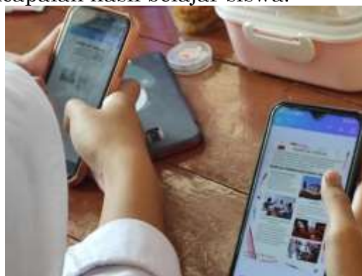
Gambar 4. Siswa mencoba dan mempelajari aplikasi canva.com

Pada tahapan ini, pengamatan juga menyoroti bagaimana hasil belajar siswa sesuai dengan skenario pembelajaran yang telah direncanakan sebelumnya. Informasi ini penting untuk mengevaluasi efektivitas metode pembelajaran yang telah diterapkan dan sejauh mana tujuan hasil belajar telah tercapai. Dengan demikian, tahapan pengamatan dalam PTK tidak hanya memberikan gambaran terhadap pelaksanaan pembelajaran, tetapi juga memberikan pemahaman mendalam terkait dampaknya terhadap pencapaian hasil belajar siswa.