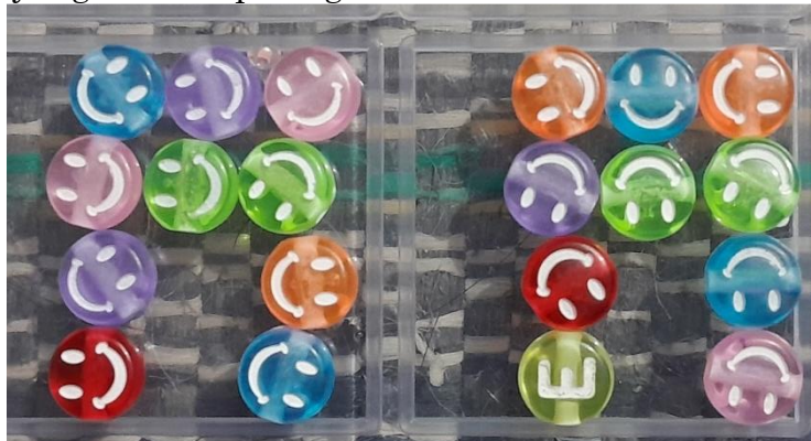
Gambar 1. Media Pembelajaran Manik-Manik Berwarna

Dalam penelitian ini untuk mengatasi masalah belajar anak tunagrahita adalah dengan menggunakan media manik-manik. Adapun bentuk manik-manik yang digunakan seperti yang terlihat pada gambar berikut.