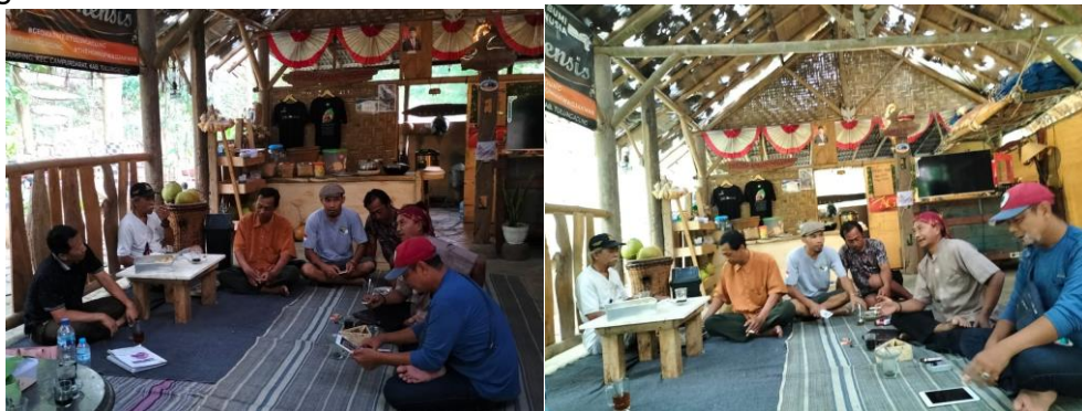
Gambar 2. Kegiatan FGD

Kegiatan FGD dihadiri pengurus Pokdarwis Wajakensis yang bertujuan untuk menggali potensi wisata dan permasalahan pengembangan pariwisata di Desa Gamping.