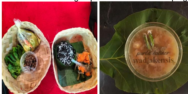
Gambar 6. Potensi Wisata Kuliner Desa Gamping