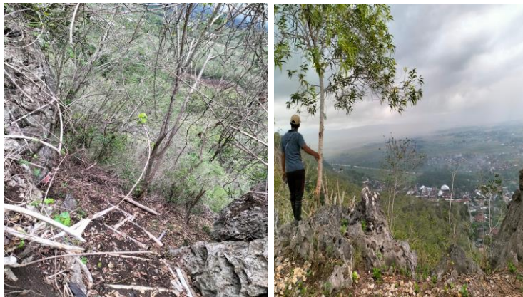
Gambar 5. Pemandangan perbukitan Desa Gamping