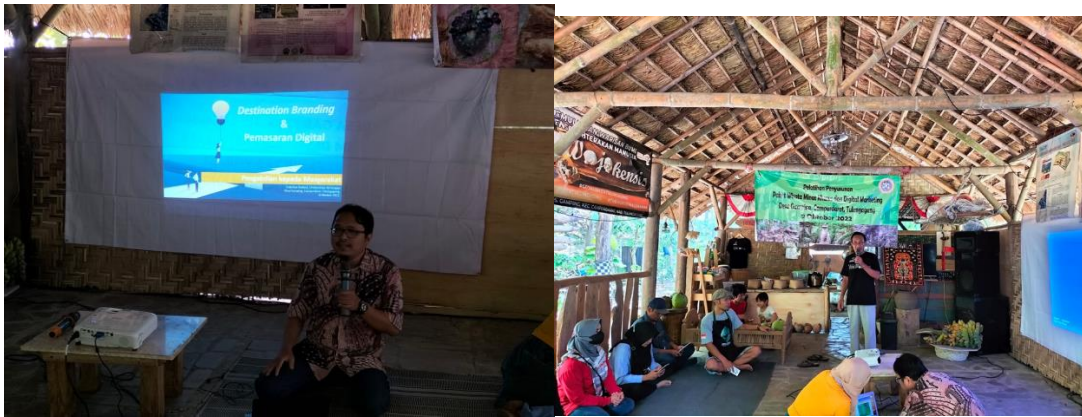
Gambar 9. Kegiatan Pelatihan Digital Marketing

Wisatawan yang berkunjung ke daerah tujuan wisata tidak sekedar menikmati panorama, tetapi bisa mendapatkan informasi yang dibutuhkan dan berinteraksi dengan masyarakat, bahkan mereka menikmati kuliner tradisional yang ada di sekitar daerah tujuan wisata. Pengalaman berwisata di tempat tujuan wisata, tidak lepas dari konsumsi makanan selama wisatawan tinggal. Makanan merupakan bagian penting dari liburan, sehingga kunjungan ke restoran cenderung menjadi pengalaman puncak bagi para wisatawan. Untuk menunjang pengembangan pariwisata dibutuhkan penguatan penguatan poduk lokal, salah satunya adalah kuliner berbahan lokal. Penguatan kuliner lokal berbahan lokal. Untuk meningkatkan skill pengolahan kuliner lokal, diberikan pelatihan pembuatan stik pisang dan minuman kebugaran lokal.