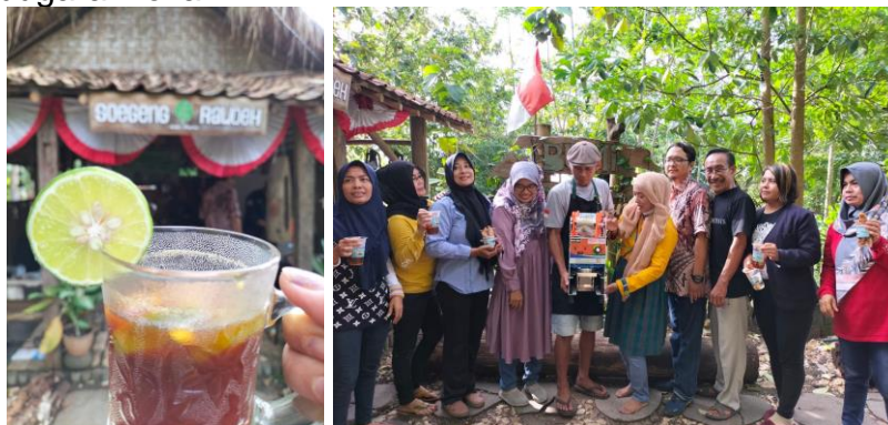
Gambar 10. Pelatihan Penguatan Kuliner Lokal

Wisatawan yang berkunjung ke daerah tujuan wisata tidak sekedar menikmati panorama, tetapi bisa mendapatkan informasi yang dibutuhkan dan berinteraksi dengan masyarakat, bahkan mereka menikmati kuliner tradisional yang ada di sekitar daerah tujuan wisata. Pengalaman berwisata di tempat tujuan wisata, tidak lepas dari konsumsi makanan selama wisatawan tinggal. Makanan merupakan bagian penting dari liburan, sehingga kunjungan ke restoran cenderung menjadi pengalaman puncak bagi para wisatawan. Untuk menunjang pengembangan pariwisata dibutuhkan penguatan penguatan poduk lokal, salah satunya adalah kuliner berbahan lokal. Penguatan kuliner lokal berbahan lokal. Untuk meningkatkan skill pengolahan kuliner lokal, diberikan pelatihan pembuatan stik pisang dan minuman kebugaran lokal.