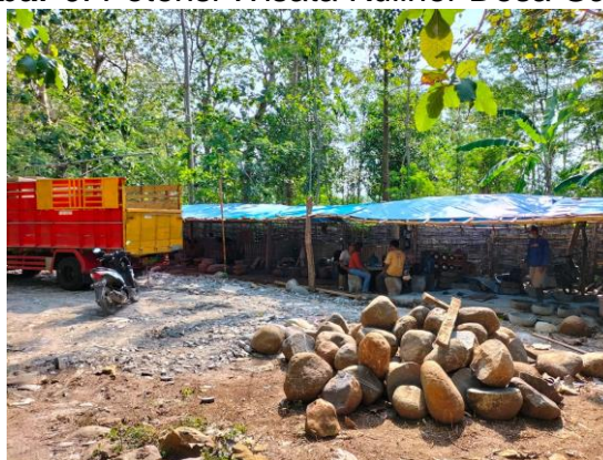
Gambar 7. Potensi Wisata Edukasi Pengolahan Batu dan Marmer

Adapun paket wisata yang dapat dikembangkan di Desa Wisata Gamping antara lain yaitu paket wisata susur goa, paket wisata edukasi homo wajakensis, dan paket wisata kuliner.