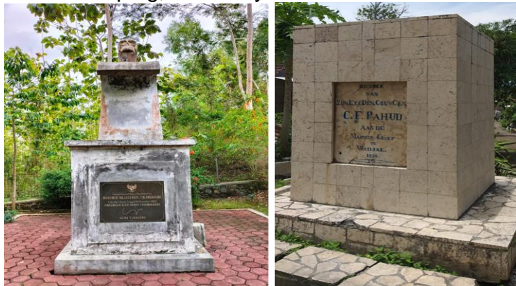
Gambar 3. Situs Homo Wajakensi