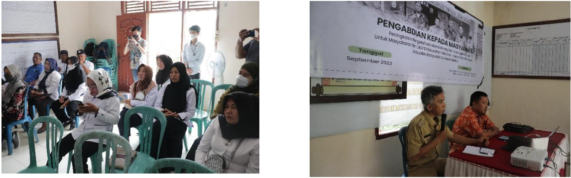
Gambar 3.3 Kegiatan penyampaian materi