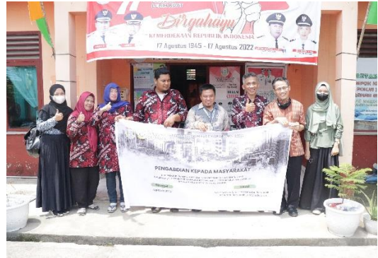
Gambar 3.1 Diskusi bersama tim kelurahan