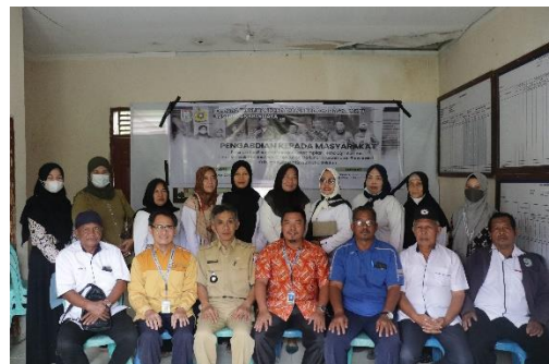
Gambar 3.2 Persiapan dan pembukaan kegiatan