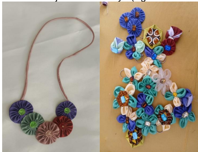
Gambar 5. Hasil Produk Daur Ulang Siap Jual

Aspek ekonomi kegiatan ini menumbuhkan budaya wirausaha baru di kalangan peserta. Beberapa anggota komunitas mulai memasarkan hasil karya mereka di pasar lokal, pameran UMKM, dan media sosial dengan harga jual berkisar antara Rp20.000 hingga Rp100.000 per produk. Aktivitas tersebut tidak hanya meningkatkan pendapatan rumah tangga, tetapi juga membuka peluang ekonomi kreatif berbasis lingkungan yang berkelanjutan (Istiyani et al., 2024). Dalam jangka panjang, terbentuknya kelompok usaha “Tumbihe Kreatif” mencerminkan transformasi nyata masyarakat dari penerima manfaat menjadi pelaku ekonomi kreatif yang mandiri, berdaya saing, serta berkontribusi aktif dalam pembangunan ekonomi hijau di daerahnya (Agustino & Irnawati, 2025).