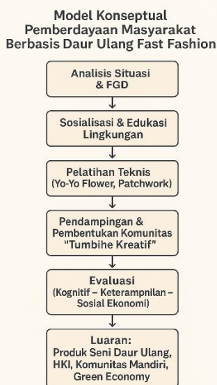
Gambar 1. Model Konseptual Pemberdayaan Masyarakat Berbasis Daur Ulang Fast Fashion

Melalui model ini, kegiatan pengabdian diharapkan mampu menghasilkan dampak berlapis ( multiplier effect ) yakni tidak hanya menurunkan limbah tekstil, tetapi juga meningkatkan pendapatan, memperkuat solidaritas sosial, dan menumbuhkan kesadaran seni sebagai bagian dari gaya hidup berkelanjutan. Model konseptual ini divisualisasikan pada Gambar 1 berikut.