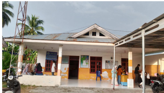
Gambar 2. Koordinasi Tim Pengabdian dengan Aparat Kelurahan

Kegiatan diawali dengan sosialisasi kepada aparat kelurahan dan warga untuk memperkenalkan tujuan program serta urgensi pengelolaan limbah tekstil di lingkungan sekitar. Melalui pendekatan participatory rural appraisal , tim melakukan diskusi kelompok terarah (FGD) guna memetakan potensi lokal, peran masyarakat, serta jenis limbah yang dapat diolah. Sosialisasi berhasil membangun kesadaran ekologis dan rasa memiliki terhadap program, yang ditunjukkan oleh antusiasme peserta membawa bahan kain bekas dari rumah sebagai kontribusi pribadi.