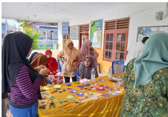
Gambar 3. Peserta Pelatihan Membuat Yo-Yo Flower

Proses dimulai dari pemilihan bahan, pemotongan kain bekas berbentuk lingkaran, menjahit dengan teknik jelujur, hingga merangkai hasil menjadi produk dekoratif seperti taplak meja, bros, gantungan kunci, dan kalung kain. Kegiatan dilakukan dalam suasana kolaboratif yang menumbuhkan kreativitas dan solidaritas antarwarga.