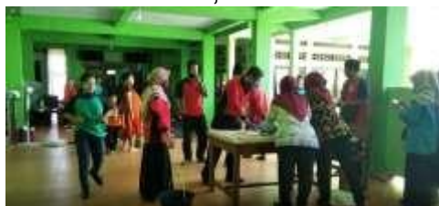
Gambar 6. Pelatihan Mencetak Kain Batik

Pada tanggal 13 September 2020, pelatihan atau kursus cetak dan mewarnai dilakukan di SLBN Karangrejo. Jumlah peserta pelatihan mencetak dan mewarnai adalah 25 siswa dan 8 guru dari SLBN Karangrejo. Siswa juga dibantu oleh guru SLBN Karangrejo Madiun dan beberapa mahasiswa Universitas PGRI Madiun dalam latihan mencetak dan mewarnai, selain bertindak sebagai panitia.