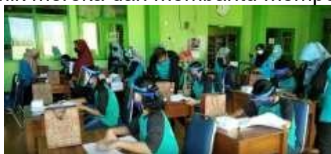
Gambar 4. Pengenalan dan Pelatihan Membuat Pola

Pada tanggal 29 Agustus 2020, tim bersama SLBN Karangrejo menyelenggarakan pelatihan membuat pola. Sembilan guru dan dua puluh siswa dari SLBN Karangrejo mengikuti pelatihan. Selain menjadi anggota panitia, mahasiswa Universitas PGRI Madiun dan guru SLBN Karangrejo juga hadir. Mahasiswa dan instruktur memiliki tanggung jawab untuk membantu siswa SLB mencapai tujuan akademik mereka dan membantu memperlancar kegiatan.