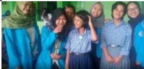
Gambar 1. Dokumentasi Kunjungsi SLBN Karangrejo

Salah satu SLB di Madiun adalah SLB Negeri Karangrejo Kabupaten Madiun yang terletak di Jalan raya Dungus No. 309 Karangrejo Kecamatan Wungu Kabupaten Madiun dengan NPSN 20507900, NSS 101050811039, NIS Propinsi/Kabupaten. SLBN Karangrejo berdiri tahun 1983 dan mulai beroperasi tahun 1984. SLB ini berdiri di atas tanah dengan status hak milik. Status akreditasi sekolah saat ini adalah B. Beberapa potensi yang dapat dikembangkan di SLBN Karangrejo adalah batik, peternakan, dan perkebunan. Selain perkebunan dan peternakan, SLBN Karangrejo juga melatih siswa untuk produksi batik. Pelatihan ini dikemas dalam bentuk kegiatan ekstrakurikuler.