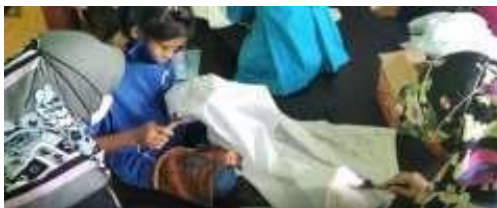
Gambar 5. Pendampingan Mencanting Kain Batik

teori, selanjutnya dilakukan pendampingan menyanting. Peserta pelatihan menyanting adalah 8 guru dan 25 siswa SLBN Karangrejo Madiun. Selain sebagai panitia, para guru SLBN Karangrejo Madiun dan beberapa mahasiswa Universitas PGRI Madiun yang mengikuti acara tersebut, mendampingi siswa berlatih menyanting.