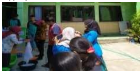
Gambar 7. Pelatihan Mewarnai Kain Batik

Aktivitas ini memungkinkan guru, siswa, dan siswa untuk belajar mencetak dan mewarnai kain batik. Siswa dan pendidik juga mempraktikkan mencetak dan mewarnai kain batik. Hasil dari kegiatan ini adalah beberapa kain batik yang dicetak dan diwarnai.