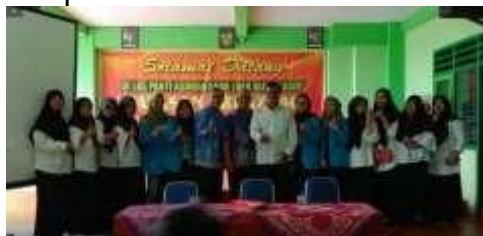
Gambar 2. Foto Bersama Setelah Sosialisasi Kegiatan

Sosialisasi kegiatan dilakukan pada tanggal 23 Maret 2020. Materi sosialisasi adalah penjelasan tujuan kegiatan dan aktivitas-aktivitas yang akan dilakukan sesuai rencana yang dituliskan dalam proposal. Selain sosialisasi, pada kesempatan ini juga dilakukan FGD untuk mendapatkan persamaan persepsi dan kesepakatan bersama antara tim dan mitra (SLBN Karangrejo) dalam melaksanakan aktivitas-aktivitas. Kesempatan tersebut meliputi kesepakatan waktu, narasumber, dan tempat melaksanakan aktivitas.