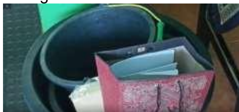
Gambar 3. Pembelian Bahan untuk Persiapan Kegiatan

Persiapan kegiatan dilakukan untuk menjamin keterlaksanaan kegiatan. Persiapan dilakukan dengan aktivitas-aktivitas yang akan dilaksanakan, yaitu workshop dan pendampingan dalam membuat pola, menyanting, mencetak dan mewarnai batik. Persiapan ini dilakukan mulai tanggal 18 Agustus 2020. Selain persiapan tim, persiapan dilakukan dengan pembelian bahan-bahan yang dibutuhkan. Dalam pembelian alat dan bahan yang dibutuhkan, tim berkoordinasi dengan narasumber yang telah disepakati. Adapun narasumber yang ditunjuk adalah Ibu Sri Suwarni pengusaha batik sekaligus kepala sekolah SLB di Kabupaten Madiun. Beberapa pembelian bahan dan alat dilakukan sesuai jadwal aktivitas yang telah diagendakan.