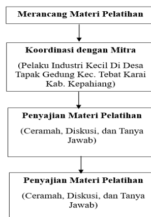
Gambar 1. Kerangka Pemecahan Masalah

Pada tahap berikutnya, teknik pelatihan dilaksanakan dengan tiga metode utama yaitu ceramah, tutorial, dan diskusi. Teknik pelatihan ceramah bertujuan memberikan motivasi kepada peserta untuk belajar tentang pengelolaan keuangan industri kecil. Kemudian, melalui pelatihan tutorial, peserta diajarkan langkah-langkah teknis mulai dari pencatatan hingga penyusunan laporan keuangan. Teknik diskusi memberi kesempatan kepada peserta untuk mendiskusikan tantangan yang dihadapi dalam pengelolaan keuangan.