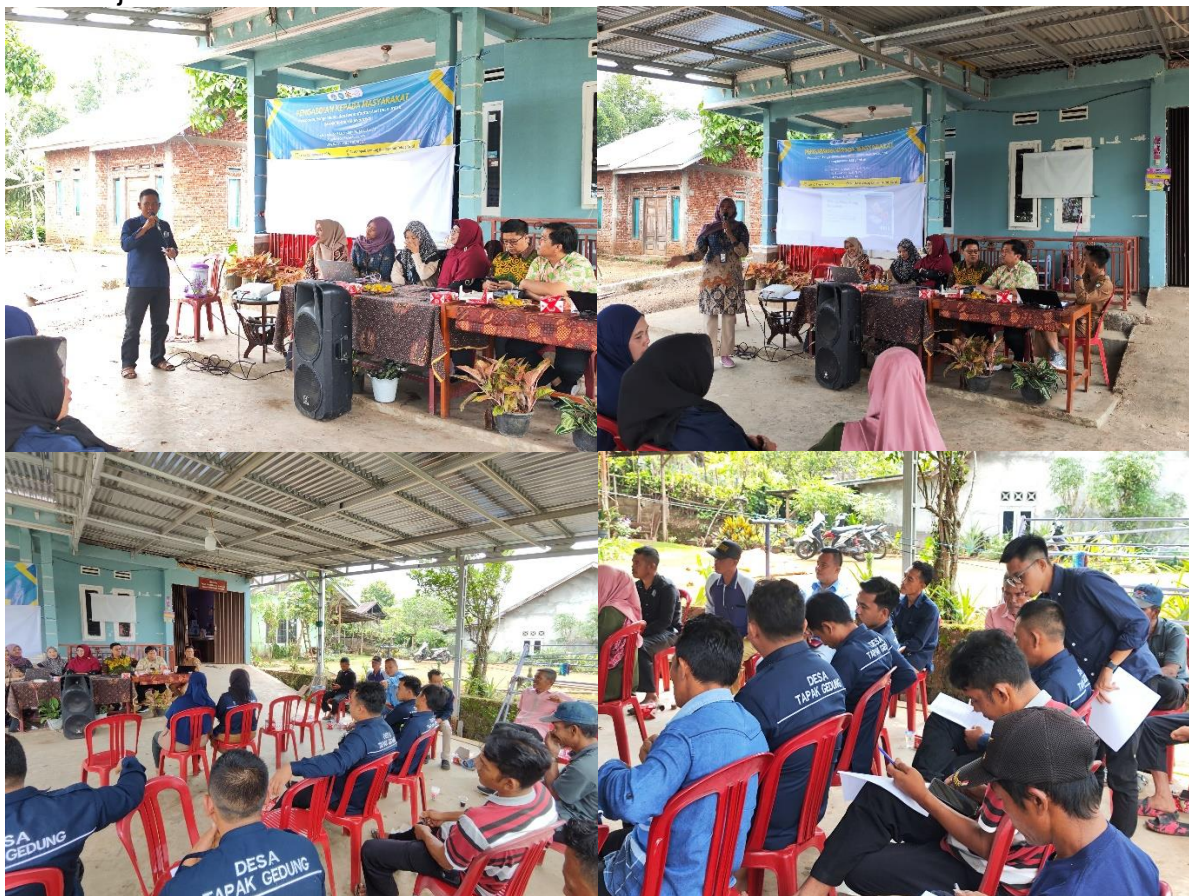
Gambar 3. Dokumentasi Pelaksanaan Kegiatan

Secara keseluruhan, program pendampingan pengelolaan keuangan ini telah memberikan dampak positif yang signifikan bagi pelaku industri kecil di Desa Tapak Gedung. Dengan pengelolaan keuangan yang lebih terstruktur dan efisien, peserta kini memiliki fondasi yang kuat untuk mengelola usaha mereka dengan lebih baik dan berkelanjutan.