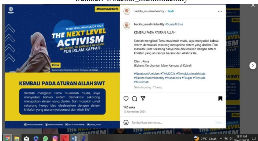
Gambar 3. Kritik Terhadap Sistem Demokrasi Indonesia Saat Ini dan Ajakan Untuk Beralih Kepada Syariat

Selanjutnya juga ada akun @gemapembebasanbogor yang telah memiliki 4.248 ribu pengikut dengan sebanyak 91 kiriman.