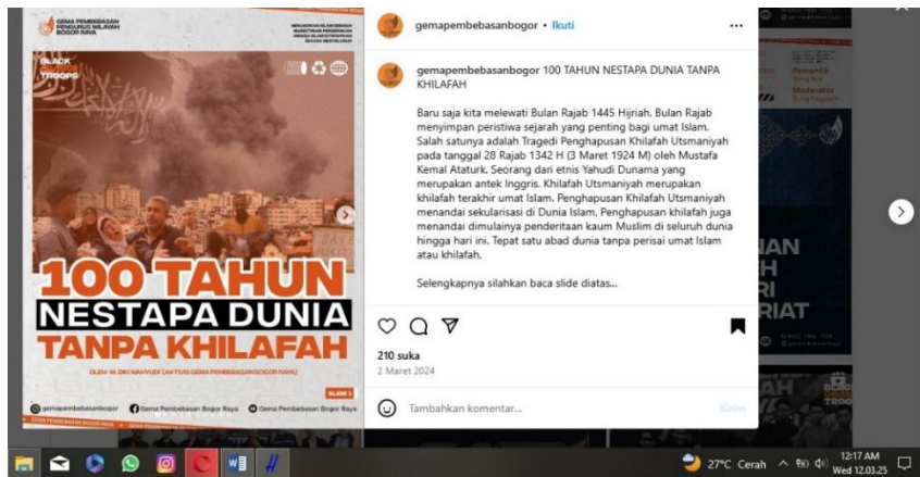
Gambar 5. Kritik Kondisi Sosial Politik dan Pemerintahan yang Kacau Akibat Sau Abad Penggunaan Sistem Pemerintahan Adopsi Barat