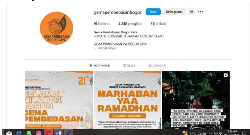
Gambar 4. Akun Lain HTI dengan Nama @gemapembebasanbogor

Selanjutnya juga ada akun @gemapembebasanbogor yang telah memiliki 4.248 ribu pengikut dengan sebanyak 91 kiriman.