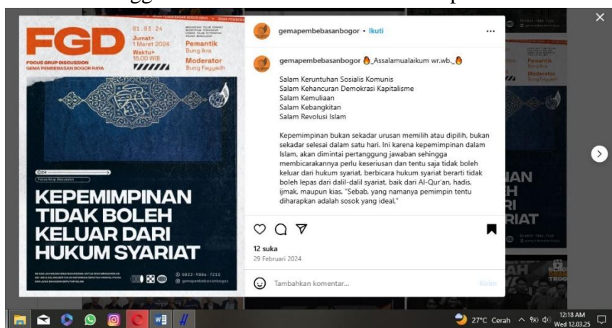
Gambar 6. Himbuan Mengenai Sistem Kepemimpinan yang Harus Sesuai dengan Syariat