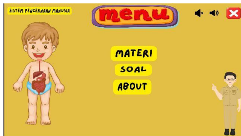
Gambar 3. Halaman Menu