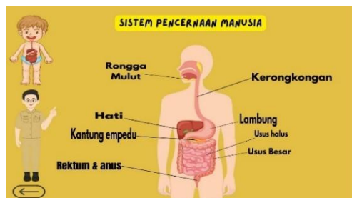
Gambar 5. Halaman Organ Sistem Pencernaan