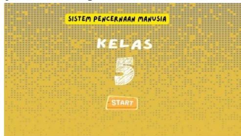
Gambar 2. Screen Mulai

Pada tahap Development penulis mengembangkan user flow diagram serta sketsa media pembelajaran interaktif menjadi sebuah aplikasi media interaktif sebagai berikut: