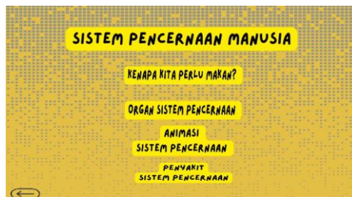
Gambar 4. Halaman Materi