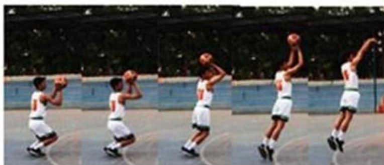
Gambar 2. Three Point Shoot

Dalam teknik three point shoot dapat dilihat dari segi titik berat berada di sekitar panggul dan termasuk ke dalam kesetimbangan stabil ini dapat dilihat dari prinsip hukum kesetimbangan I yang menyatakan bahwa titik proyeksi jatuh pada bidang tumpuan, untuk prinsip hukum kesetimbangan III bahwa semakin berat seseorang maka semakin stabil dan menggunakan prinsip hukum kesetimbangan V yaitu jarak vertical berbanding terbalik dengan stabilitas, artinya ketika atlet merendahkan badanya lebih rendah maka ia akan semakin stabil dan cepat, apabila dilihat dari segi tuasnya maka termasuk ke dalam tuas kelas I yaitu KPB (kekuatan, poros, beban) dan untuk gerakan ini termasuk efisien, untuk kekuatan yang digunakan disini ada power otot lengan dan power otot tungkai (Supriatna, 2023). Secara rinci, analisis three point shoot dapat dilihat pada gambar berikut ini.