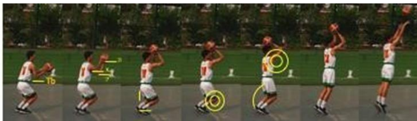
Gambar 1. Free Trow Shoot