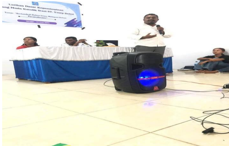
Gambar 3. Materi Teknik Public Speaking Disertai Praktek