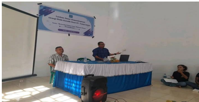
Gambar 2. Materi dari Seksi Kepemudaan Keuskupan Wilayah Kei Kecil

OMK merupakan sebuah wadah yang dapat menghimpun para pemuda Katolik untuk terus melayani Tuhan dan sesama, sebagai sebuah komunitas keagamaan. Pelayanan itu diwujudkan oleh berbagai macam program sosial dan keagamaan yang dibuat komunitas ini, misalkan bakti sosial, membentuk komunitas doa, serta seminar atau pelatihan bertemakan pendalaman iman. Seseorang yang terlibat dalam komunitas ini dapat mengisi waktu luang mereka dengan berinteraksi dengan sesama anggota OMK, dan membentuk berbagai pengalaman iman di dalam program-program sosial-keagamaan. Demi menanamkan pemahaman keberadaan OMK, tim membawakan materi pengenalan OMK sebagai organisasi kategorial gereja Katolik.