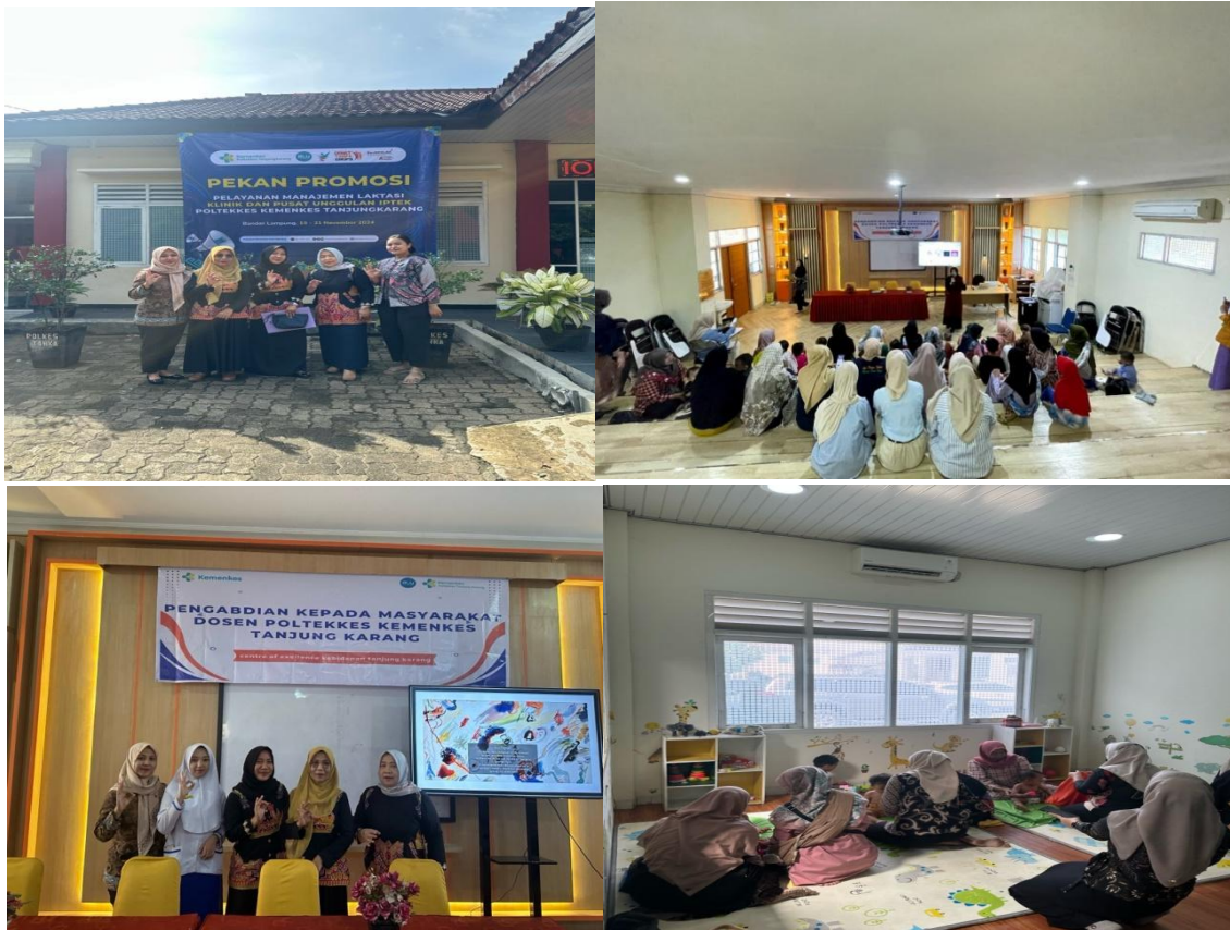
Gambar 1. Pelaksanaan Edukasi Pijat Bayi