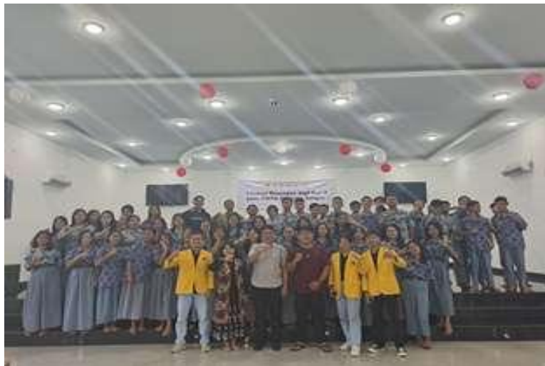
Gambar 1. Peserta Kegiatan

Pasar modal dikatakan memiliki fungsi ekonomi karena pasar menyediakan fasilitas atau wahana yang mempertemukan dua kepentingan yaitu pihak yang memiliki kelebihan dana ( investor ) dan pihak yang memerlukan dana ( issuer ). Dengan adanya pasar modal maka pihak yang memiliki kelebihan dana dapat menginvestasikan dana tersebut dengan harapan memperoleh imbalan ( return ) berupa dividen, sedangkan pihak issuer (dalam hal ini perusahaan) dapat memanfaatkan dana tersebut untuk kepentingan investasi tanpa harus menunggu tersedianya dana dari kegiatan operasi perusahaan. Pasar modal dikatakan memiliki fungsi keuangan, karena pasar modal memberikan kemungkinan dan kesempatan memperoleh imbalan ( return ) bagi pemilik dana, sesuai dengan karakteristik investasi yang dipilih. Hal tersebut juga berkaitan dengan pentingnya peningkatan literasi keuangan pada Gen Z untuk menuju Indonesia emas 2045 (Putro et al., 2024) dan Selain itu literasi keuangan juga mendukung program SDGs di Indonesia (Indriastuti et al., 2023).