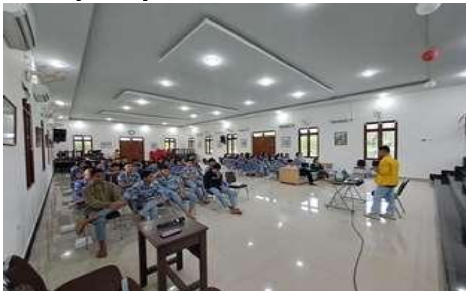
Gambar 2. Simulasi Literasi Keuangan

Menggunakan studi kasus dan permainan simulasi untuk memberikan pengalaman praktis dalam mengambil keputusan investasi.