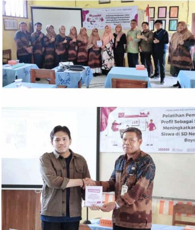
Gambar 3. Kegiatan Pelatihan Pemaparan Materi

Gambar 3 menunjukkan dokumentasi sesi kegiatan pemaparan materi yang kemudian dilanjutkan mempraktekan dari materi yang sudah dijelaskan dengan mengambil langsung gambar dan video pada lingkungan sekolah tersebut seperti pada gambar 4. Hasil gambar dan video yang sudah diambil kita pilih yang terbaik untuk diedit dan digabungkan untuk menjadi suatu kesatuan dalam video profile. setelah melakukan editing video maka video yang sudah diedit dipublish ke chanel youtube sekolah untuk disebarluaskan dalam media sosial sekolah untuk memperluas pengenalan sekolah dengan media promosi digital. Gambar 5 meunjukkan potongan/cuplikan dari video yang sudah diupload dichanel youtube sekolah SD negeri 2 ngesrep Boyolali.