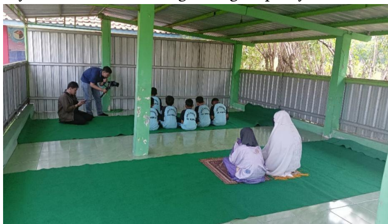
Gambar 4. Kegiatan Pengambilan Video dan Gambar

Gambar 3 menunjukkan dokumentasi sesi kegiatan pemaparan materi yang kemudian dilanjutkan mempraktekan dari materi yang sudah dijelaskan dengan mengambil langsung gambar dan video pada lingkungan sekolah tersebut seperti pada gambar 4. Hasil gambar dan video yang sudah diambil kita pilih yang terbaik untuk diedit dan digabungkan untuk menjadi suatu kesatuan dalam video profile. setelah melakukan editing video maka video yang sudah diedit dipublish ke chanel youtube sekolah untuk disebarluaskan dalam media sosial sekolah untuk memperluas pengenalan sekolah dengan media promosi digital. Gambar 5 meunjukkan potongan/cuplikan dari video yang sudah diupload dichanel youtube sekolah SD negeri 2 ngesrep Boyolali.