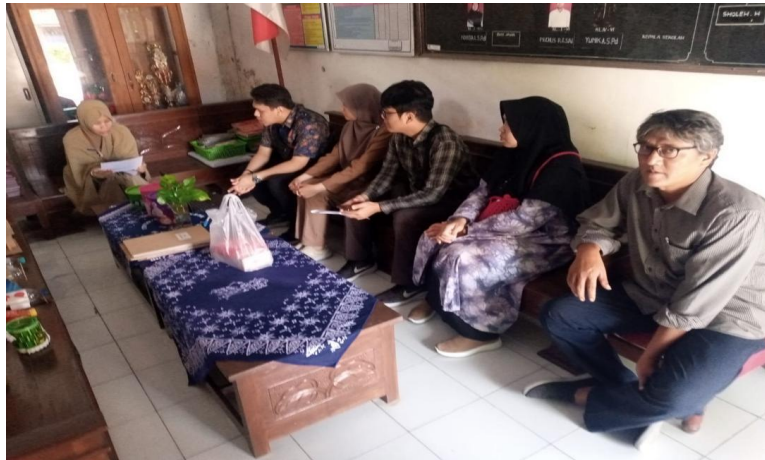
Gambar 2. Kegiatan Observasi Lapangan

pembuatan video profil sebagai strategi promosi sekolah. Melalui hasil observasi ini, kami tim pelaksana dapat memperoleh gambaran menyeluruh tentang profil sekolah, tantangan yang dihadapi, dan potensi yang dapat ditonjolkan dalam video profil nantinya.