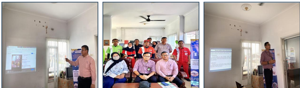
Gambar 1. Pemateri dan Foto Bersama