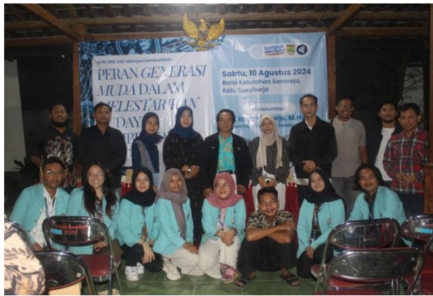
Gambar 6. Hasil Sosialisasi Pelestarian Wayang dan Pelatihan Pranatacara