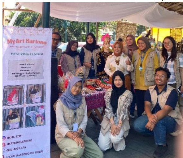
Gambar 2. Pameran Solo Art Market

Selain itu, pelatihan ini juga mempersiapkan peserta untuk memamerkan hasil karyanya di pameran Solo Art Market , dimana peserta dapat memperkenalkan dan mempromosikan produk seni khas yang dimiliki masing-masing seperti dari Kelurahan Sonorejo ini kepada masyarakat umum. Dengan berkolaborasi dengan pameran Solo Art Market , diharapkan Kelurahan Sonorejo semakin meningkatkan profilnya sebagai pusat kesenian tradisional Wayang Tatah Sungging dan menciptakan peluang ekonomi baru bagi pengrajin lokal. Program ini juga bertujuan untuk menjaga kelestarian seni Wayang Tatah Sungging dengan melibatkan generasi muda dalam proses pelestarian dan memanfaatkan platform seni modern untuk mempromosikan kekayaan budaya asli daerah seperti yang terlihat dari Gambar 2 yang merupakan promosi dari UMKM MyArtHartono milik Pak Hartono dari Kelurahan Sonorejo.