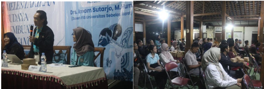
Gambar 5. Proses Pemaparan Materi oleh Narasumber

lebih kuat dalam melestarikan budaya lokal. Meskipun kedua kegiatan ini dilaksanakan bersamaan, antusias dan semangat dari pemuda dan tokoh masyarakat di Kelurahan Sonorejo dapat terlihat dari Gambar 5 dan Gambar 6.