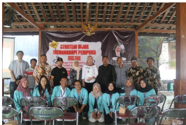
Gambar 4. Sesi Foto Bersama Narasumber