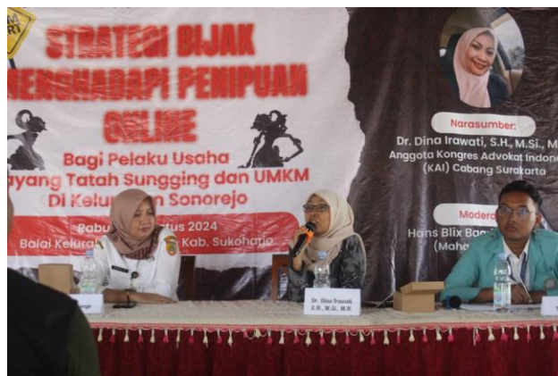
Gambar 3. Pemaparan Materi dari Narasumber

Melalui sosialisasi ini, para pelaku usaha Wayang Tatah Sunggin dan usaha kecil menengah di Kelurahan Sonorejo diharapkan dapat meningkatkan kewaspadaannya terhadap ancaman penipuan online dan menjadi lebih cerdas dalam transaksi di platform digital. Manfaat lainnya adalah menciptakan lingkungan usaha yang lebih terasa aman dan terpercaya bagi konsumen maupun pelaku usaha, dimana para pemangku kepentingan bisnis dapat beroperasi dengan tenang tanpa khawatir akan risiko penipuan. Pelaksanaan acara sosialisasi dapat terlihat dari Gambar 3 dan Gambar 4 berikut.