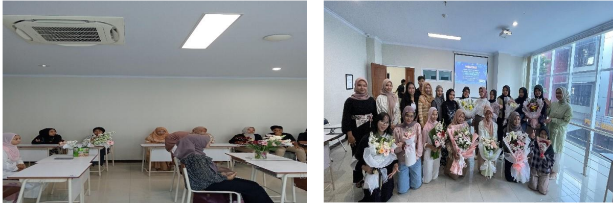
Gambar 2. Dokumentasi Lomba Merangkai Bunga