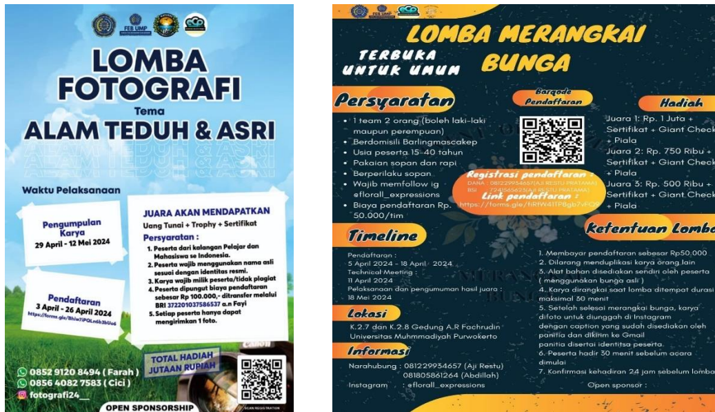
Gambar 1. Gambar Leaflet Lomba

Pada kegiatan promosi untuk merekrut peserta ini diperoleh peserta untuk lomba merangkai bunga sebanyak 11 tim (1 tim adalah 2 orang) dan lomba fotografi diperoleh peserta sebanyak 14 orang.