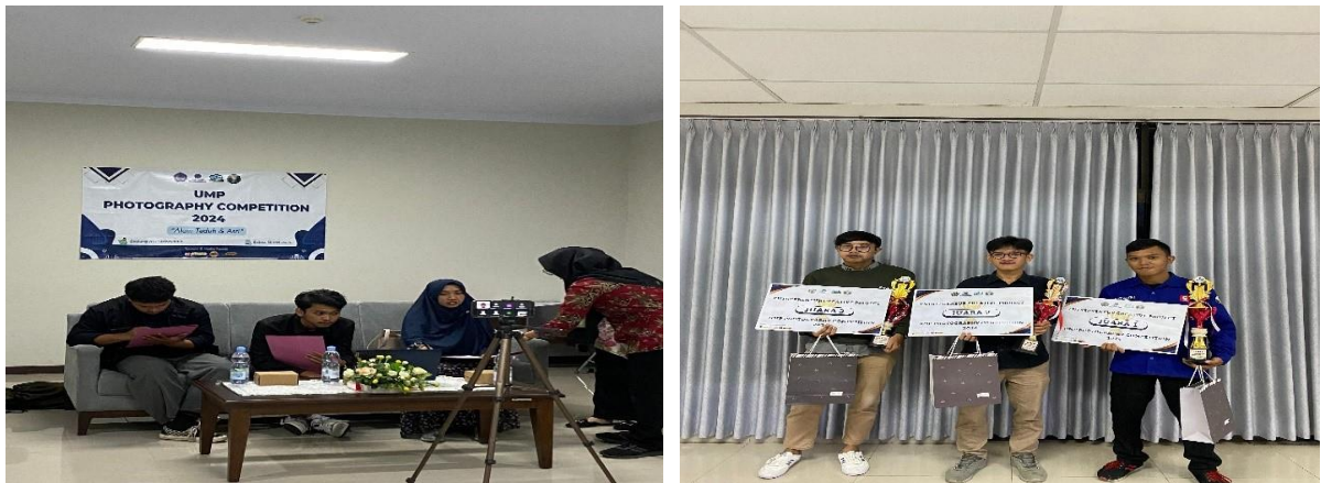
Gambar 3. Dokumentasi Lomba Fotografi