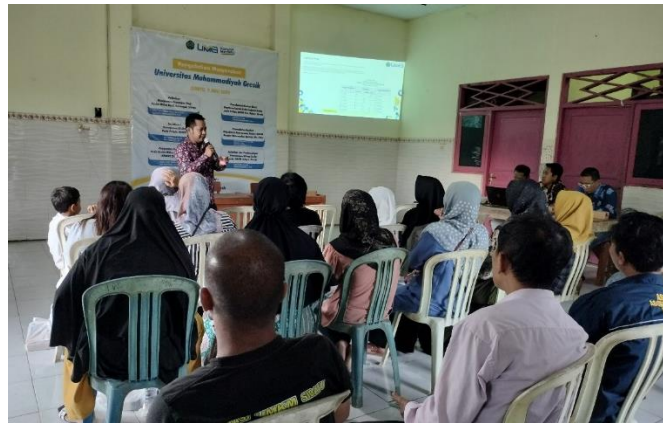
Gambar 2. Suasana Workshop Pelatihan

Terlihat pada Gambar 2 merupakan suasana kegiatan workshop pelatihan Ms Excel bagi pelaku UMKM.