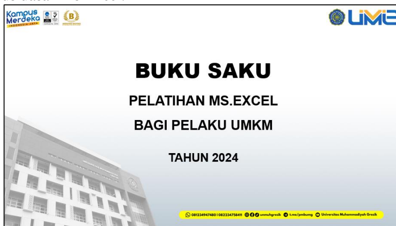
Gambar 3. Buku Saku Ms Excel

Berikut merupakan gambar cover buku saku yang diberikan kepada peserta untuk melihat rumus dasar Ms Excel.