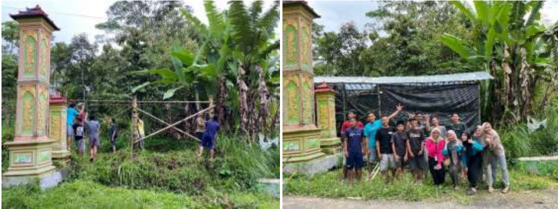
Gambar 1. Pembuatan Tempat Bank Sampah