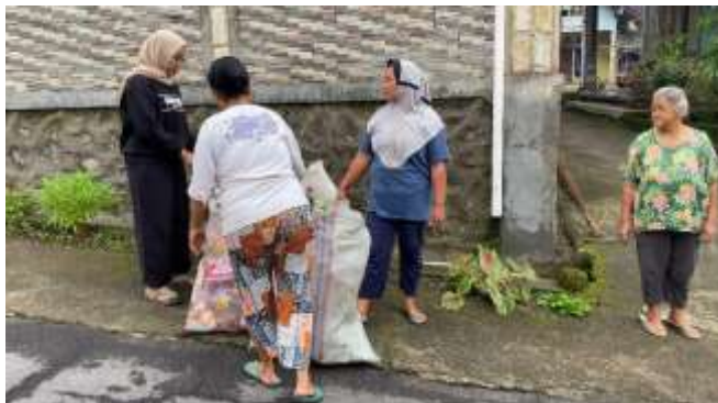
Gambar 3. Proses Pengumpulan Sampah

ke tempat bank sampah untuk selanjutnya dilakukan pemilahan sesuai jenisnya. Setelah semua sampah sudah dikelompokkan, humas bank sampah menghubungi pihak pengepul untuk dijual, yang kemudian bendahara melakukan pencatatan hasil penjualan.