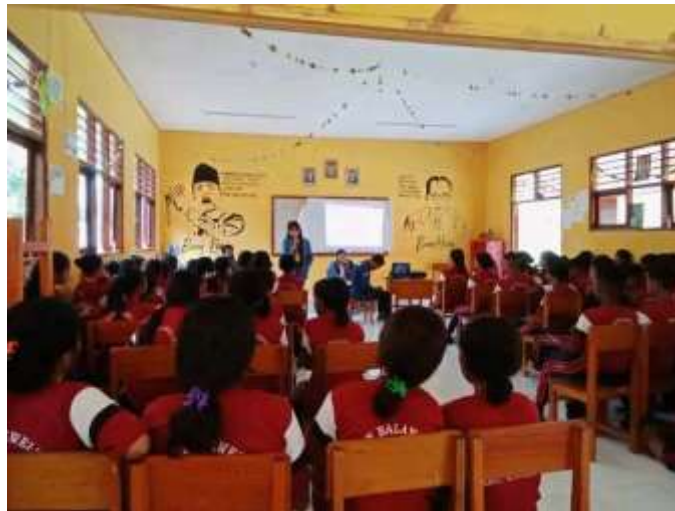
Gambar 2. Memberikan Sosialisasi

Pada gambar 2 merupakan tahap memberikan sosialisasi di SMPN Balaweling serta rangsangan berpikir dan pengetahuan tambahan tentang topik pelestarian tenun ikat sebelum peserta didik melakukan pelatihan. Para peserta didik juga sangat berantusias dalam kegiatan sosialisasi tersebut.