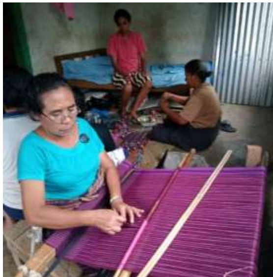
Gambar 3. Kegiatan Menenun

Pada gambar 2 merupakan tahap memberikan sosialisasi di SMPN Balaweling serta rangsangan berpikir dan pengetahuan tambahan tentang topik pelestarian tenun ikat sebelum peserta didik melakukan pelatihan. Para peserta didik juga sangat berantusias dalam kegiatan sosialisasi tersebut.