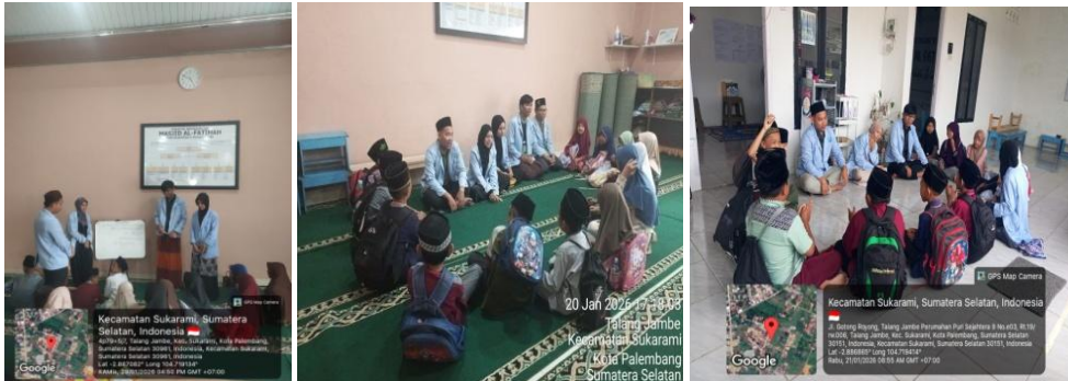
Gambar 2. Dokumentasi Kegiatan Pembelajaran

komunikatif sehingga santri tidak merasa tertekan selama belajar. Hasil kegiatan menunjukkan adanya peningkatan kemampuan membaca Al-Qur'an dan hafalan santri. Santri menjadi lebih disiplin dalam mengulang hafalan, lebih percaya diri saat menyetorkan hafalan, serta lebih aktif mengikuti kegiatan pembelajaran tahfidz dan murojaah.