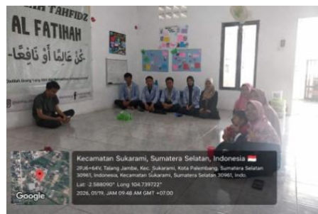
Gambar 1. Survey Lokasi dan Pemberian Surat Izin

Berdasarkan hasil observasi tersebut, mahasiswa KKN menyusun beberapa program kerja yang berfokus pada pembinaan pendidikan, keagamaan, dan sosial dengan menggunakan metode pembelajaran yang lebih kreatif, interaktif, dan menyenangkan agar santri lebih aktif dan antusias dalam mengikuti kegiatan pembelajaran.