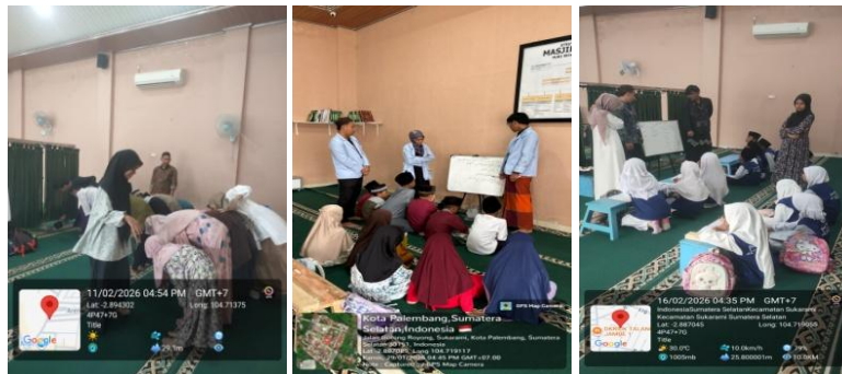
Gambar 3. Pemberian Materi Tambahan

Berbagai materi tambahan yang diberikan oleh mahasiswa KKN tidak hanya bertujuan untuk meningkatkan kemampuan akademik dan keagamaan santri, tetapi juga membentuk karakter, keterampilan komunikasi, kedisiplinan, serta rasa percaya diri. Melalui kegiatan yang dikemas secara interaktif dan menyenangkan, santri menjadi lebih aktif dalam mengikuti proses pembelajaran dan mampu mengimplementasikan nilai-nilai Islam dalam kehidupan sehari-hari.