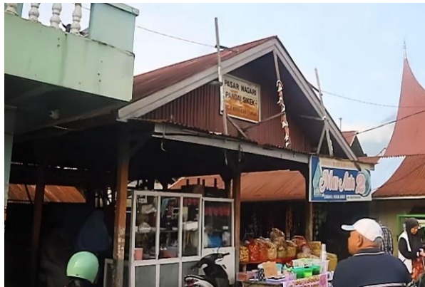
Gambar 3. Pengambilan Dokumentasi Video di Pasar Nagari Pandai Sikek

Foto menampilkan suasana Pasar Nagari Pandai Sikek sebagai salah satu objek dalam video promosi UMKM. Pasar nagari menjadi ruang aktivitas ekonomi masyarakat sekaligus bagian dari identitas sosial Nagari Pandai Sikek.