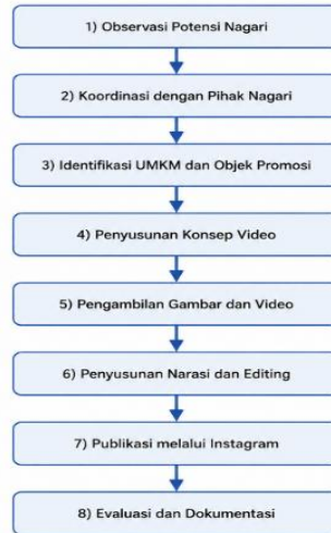
Gambar 1. Diagram Alur Pelaksanaan Video Promosi UMKM Nagari Pandai Sikek