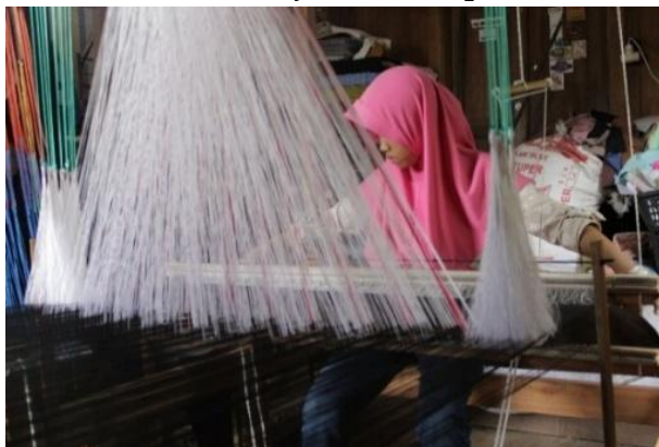
Gambar 4. Proses Penenunan Songket Pandai Sikek

Tenun songket menjadi salah satu fokus utama dalam video promosi karena merupakan produk unggulan Nagari Pandai Sikek. Berdasarkan transkrip video, songket digambarkan sebagai kerajinan yang dibuat dengan kesabaran, memiliki motif dan detail berkualitas, serta telah dikenal luas. Jadesta juga menjelaskan bahwa songket Pandai Sikek dibuat secara manual dan tradisional serta menjadi identitas budaya masyarakat setempat (Kementerian Pariwisata Republik Indonesia, 2025). Dokumentasi proses penununan penting untuk memperlihatkan nilai budaya, keterampilan, dan kualitas produk lokal.