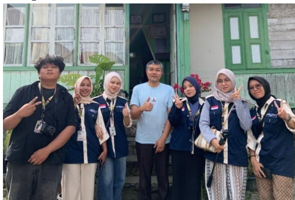
Gambar 2. Koordinasi dan Foto Bersama Pelaku Songket

Pada tahap pelaksanaan kegiatan, mahasiswa KKN Reguler Universitas Negeri Padang melakukan koordinasi dengan pelaku usaha songket di Nagari Pandai Sikek untuk meminta izin sekaligus menyampaikan tujuan pengambilan video sebagai media promosi UMKM lokal. Koordinasi ini dilakukan agar proses pembuatan video berjalan lancar dan isi video dapat menampilkan proses pembuatan serta keunikan songket Pandai Sikek sesuai kondisi di lapangan. Pelibatan pelaku UMKM dalam kegiatan promosi digital juga penting agar konten yang dibuat lebih sesuai dengan karakter produk dan kebutuhan promosi masyarakat setempat (Wibisono et al., 2021).