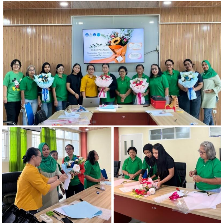
Gambar 5. Pelatihan Pembuatan Buket

Langkah – langkah pelatihan membuat buket bunga dapat dijelaskan sebagai berikut :