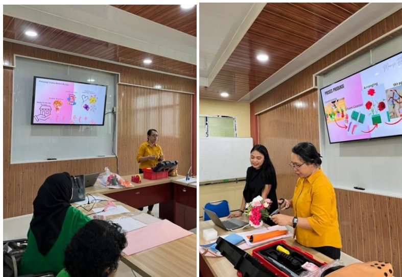
Gambar 3. Pembekalan / Pemberian Materi

Pada tahapan ini akan diberikan materi mengenai merintis usaha keluarga melalui kegiatan merangkai buket bunga merupakan langkah strategis dan inovatif dalam mendorong kemandirian ekonomi rumah tangga serta memperkuat keterlibatan seluruh anggota keluarga dalam kegiatan produktif. Kegiatan ini tidak hanya memberikan pengetahuan dasar seputar seni merangkai bunga, tetapi juga mencakup pemahaman tentang tren pasar, strategi pemasaran digital, pengelolaan keuangan usaha kecil, serta aspek pelayanan pelanggan yang profesional. Melalui pendekatan praktis dan aplikatif, peserta dilatih untuk mampu menciptakan produk yang bernilai estetika tinggi dan memiliki daya saing di pasar lokal maupun digital. Usaha merangkai buket bunga juga memiliki fleksibilitas tinggi, dapat dijalankan dari rumah dengan modal relatif terjangkau, dan cocok dikembangkan secara bertahap sesuai kapasitas keluarga. Lebih dari sekadar aktivitas kreatif, kegiatan ini dapat menjadi titik awal terbentuknya unit usaha keluarga yang solid, mandiri, dan berorientasi pada pertumbuhan jangka panjang, sehingga secara tidak langsung turut mendukung peningkatan kesejahteraan sosial dan ekonomi di lingkungan sekitarnya.