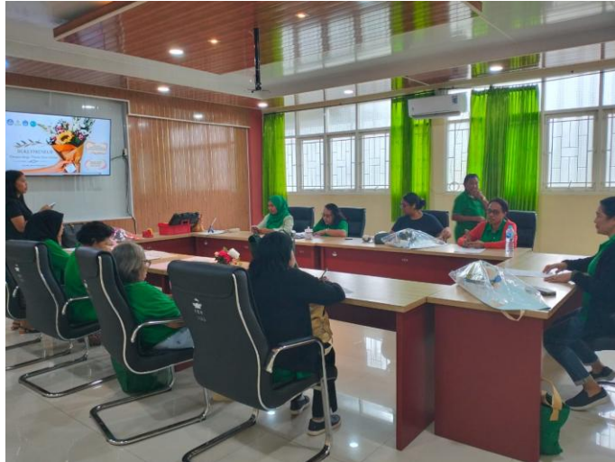
Gambar 2. Pembukaan Kegiatan Pengabdian