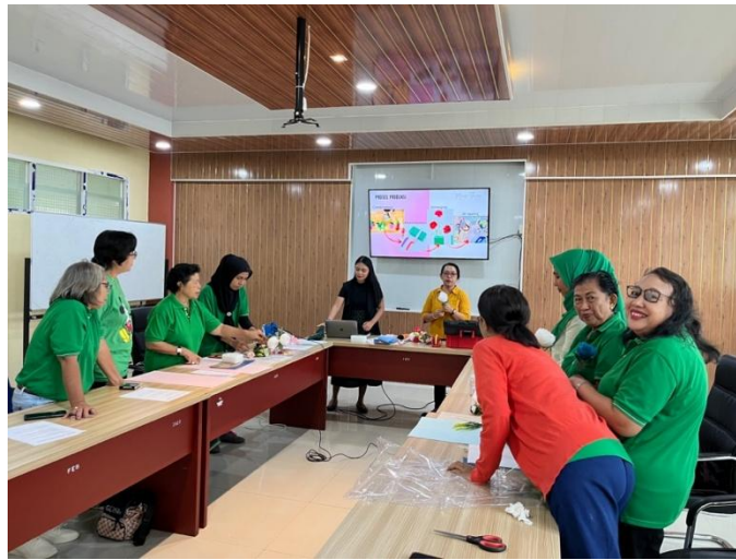
Gambar 4. Tanya Jawab

Pada tahapan ini dilakukan setelah materi disampaikan. Peserta begitu antusias untuk mengetahui lebih dalam lagi tentang usaha buket sehingga feedback para peserta melalui pertanyaan – pertanyaan yang menarik hingga berbagi pengalaman mewarnai sesi ini. Mulai dari jenis bunga yang sering diorder oleh konsumen, perpaduan warna yang cocok untuk konsumen kawula muda, menentukan ukuran buket, besarnya keuntungan yang cukup agar dapat menghasilkan harga yang bersaing, hingga pemilihan supplier. Berbekalkan pengalaman sebagai pemilik usaha Manise Flowers dan Chevedecoration, maka narasumber boleh menjawab baik dari sisi teori maupun dari sisi praktisi.