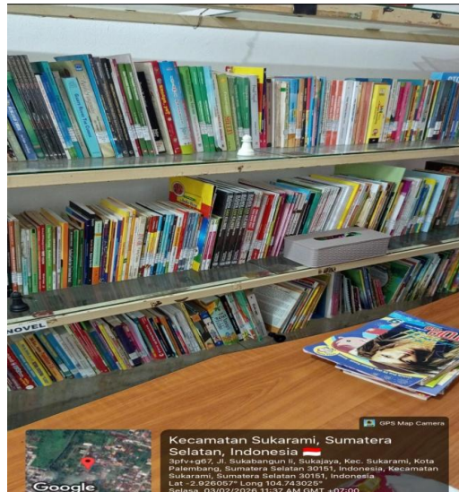
Gambar 8. Koleksi Buku