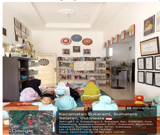
Gambar 2. Pendampingan Mengaji dan Hafalan Surat Pendek