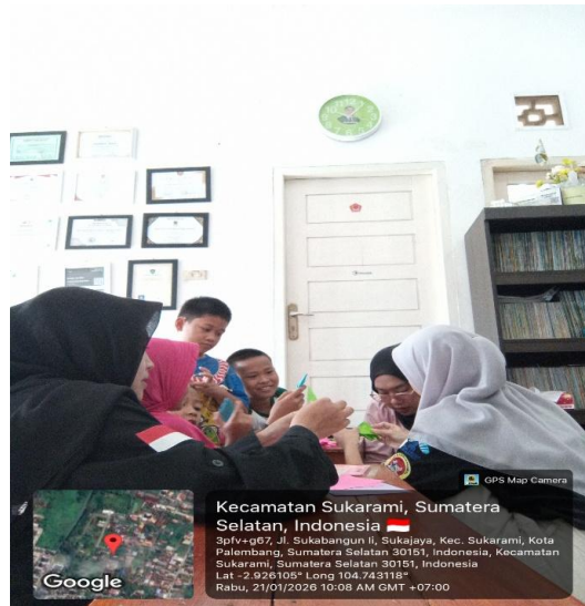
Gambar 4. Seni Kertas Origami