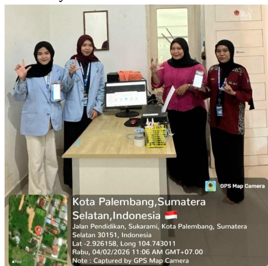
Gambar 7. Pembuatan Website Slims

Selain itu, mahasiswa juga menginput data koleksi buku ke dalam sistem SliMS, membuat kode eksemplar, dan melabeli buku sesuai klasifikasi. Proses ini bertujuan untuk mempermudah pencarian, pendataan, dan pengelompokan buku, sehingga koleksi perpustakaan menjadi lebih terorganisir. Setiap buku didata berdasarkan judul, pengarang, penerbit, tahun terbit, dan nomor klasifikasi, yang meningkatkan efektivitas pengelolaan perpustakaan (Azizah, 2022). Penataan buku juga menjadi fokus penting, di mana buku-buku yang telah terklasifikasi disusun berdasarkan kategori dan jenis bacaan. Hal ini tidak hanya meningkatkan kenyamanan dalam mencari buku, tetapi juga mendukung minat baca anak-anak di Rumah Baca Relawan Muda Peduli Nusantara. Penataan koleksi yang baik berkontribusi pada terciptanya lingkungan perpustakaan yang nyaman, edukatif, dan mendukung kegiatan literasi masyarakat.