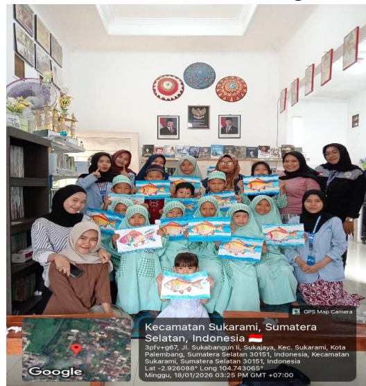
Gambar 5. Keterampilan Seni Mewarnai