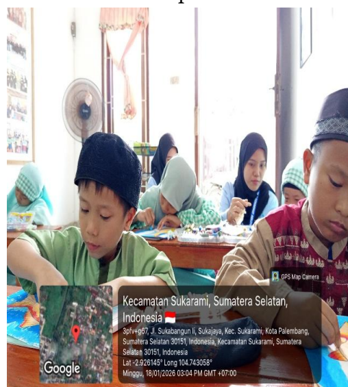
Gambar 6. Pendampingan Kelas Mewarnai