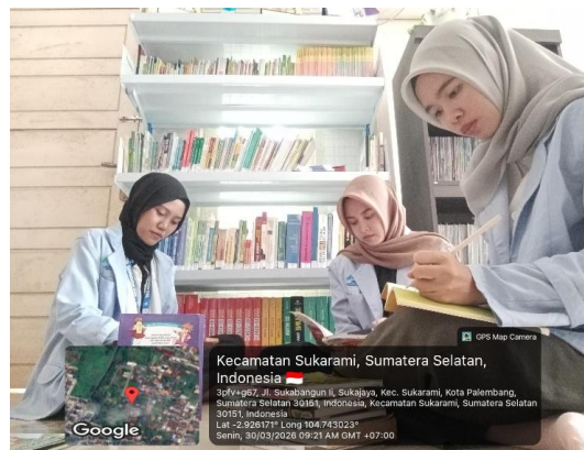
Gambar 9. Penginputan Buku ke Slims