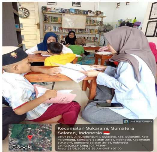
Gambar 3. Pendampingan Belajar Buku Bacaan

Selain kegiatan pendampingan belajar, mahasiswa KKN juga menambahkan aktivitas storytelling dan seni kreativitas seperti mewarnai dan menggambar sebagai bentuk dorongan dan semangat anak-anak Berimajinasi. Kegiatan storytelling menggunakan cerita edukatif dan Islami untuk melatih kemampuan mendengar dan memahami cerita, serta membangun keberanian anak dalam berkomunikasi. Aktivitas seni bertujuan untuk meningkatkan kreativitas, imajinasi, dan kemampuan anak dalam mengekspresikan ide. Dengan berbagai kegiatan ini, proses pembelajaran di Rumah Baca Relawan Muda Peduli Nusantara menjadi lebih menarik, edukatif, dan mampu meningkatkan semangat belajar anak-anak (Sa'diyah, 2024).