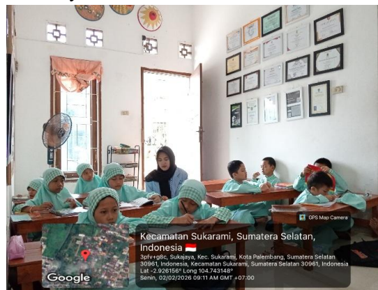
Gambar 1. Pendampingan Menulis Huruf Hijaiyah

Dalam kegiatan tersebut, Mahasiswa KKN Rekognisi Kelompok 45 berpartisipasi dalam mendukung dan mengembangkan program di Rumah Baca ini melalui pengabdian kepada masyarakat. Mereka terlibat dalam pendampingan belajar, mengajar mengaji, membimbing hafalan, dan mendukung kegiatan edukasi lainnya, sehingga proses pembelajaran menjadi lebih interaktif dan menyenangkan. Keterlibatan mahasiswa ini merupakan kontribusi nyata dalam pengembangan pendidikan nonformal dan penguatan literasi anak di lingkungan masyarakat.