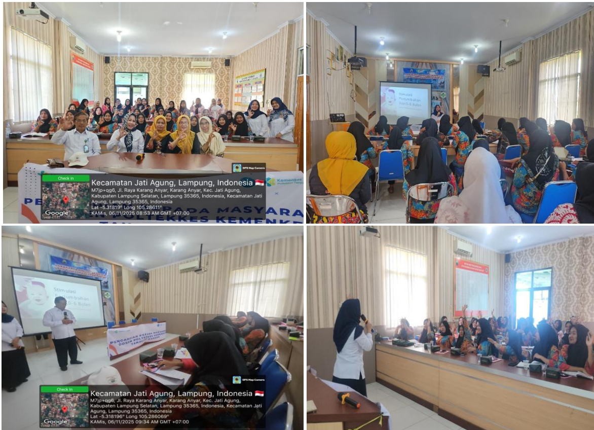
Gambar 1. Pelaksanaan Kegiatan dengan Kader Desa Karang Anyar

Kader yang hadir pada kegiatan ini sebanyak 30 orang. Sebelum kegiatan berlangsung para kader diberikan pertanyaan melalui google form untuk mengukur pengetahuan kader sebelum diberikan pemaparan. Setelah selesai mengerjakan pretest sebanyak 10 soal para kader diberikan pemaparan materi mulai dari pengertian stimulasi dan jenis-jenis stimulasi yang dapat diberikan pada bayi 0-6 bulan serta manfaatnya untuk tumbuh kembang bayi. Setelah pemaparan, peserta diberikan soal melalui google form untuk melihat peningkatan pengetahuan kader sebelum dan sesudah pemaparan.