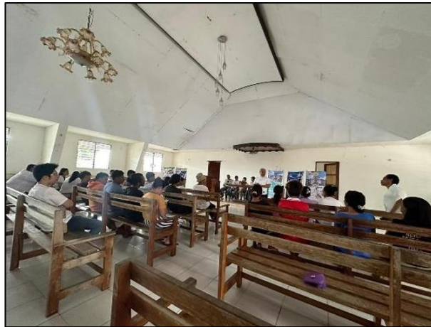
Gambar 1. Peserta Kegiatan

Program ini menunjukkan bahwa dengan bimbingan yang tepat, pelaku UMKM di daerah terpencil dapat memanfaatkan teknologi untuk meningkatkan daya saing usaha mereka. Oleh karena itu, keberlanjutan program melalui pendampingan berkala sangat diperlukan.