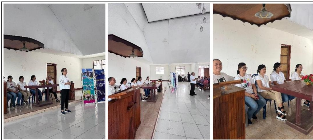
Gambar 2. Kegiatan Sosialisasi dan Pelatihan