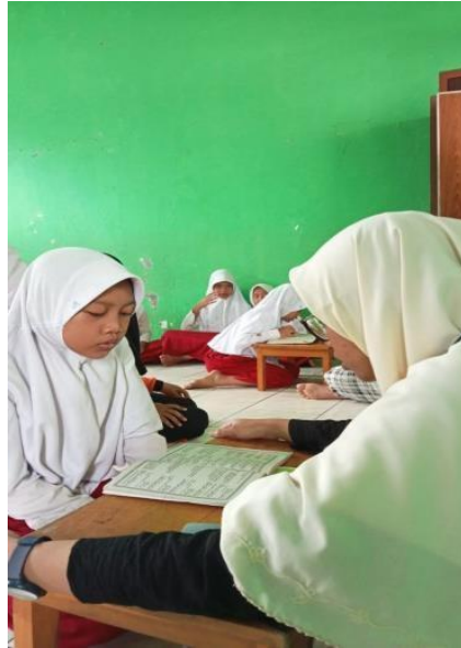
Gambar 3. Tim Pemberdaya Melakukan Observasi ke Sekolah