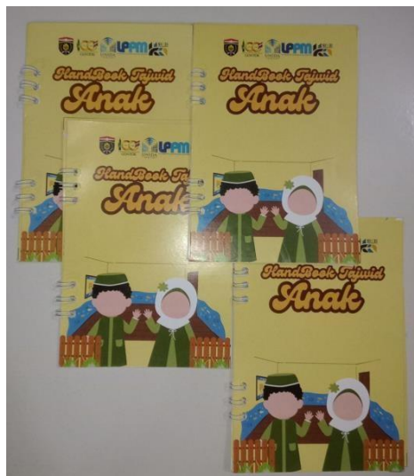
Gambar 5. Media Handbook Tajwid

Setelah menyusun kegiatan pendampingan, tim pemberdaya menyiapkan media pembelajaran yaitu handbook tajwid dengan nisi materi ilmu tajwid yang sesuai dengan tingkatan pada setiap kelas di SDN Soco 1. Media pembelajaran dapat dilihat pada gambar berikut: