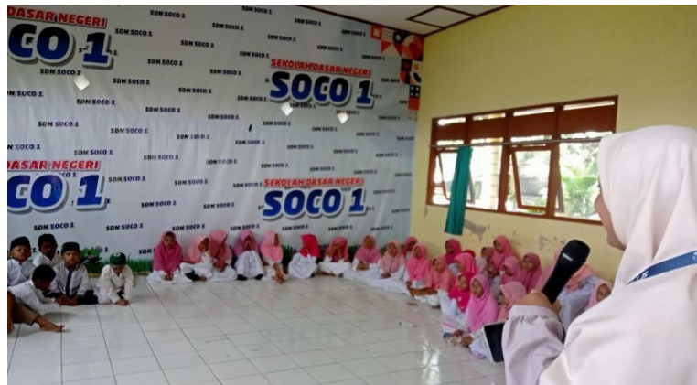
Gambar 2. Tim Pemberdaya Melakukan Observasi ke Sekolah

Observasi dilaksanakan tim pemberdaya di SDN Soco 1 yang terletak di dusun Soco desa Soco. Pada tahap observasi tim pemberdaya melakukan pengamatan langsung di sekolah.