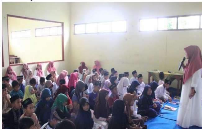
Gambar 4. Sosialisasi Handbook Tajwid dan Pembagian Pretes

Pada tahap ini, tim merancang proses yang akan digunakan saat kegiatan pendampingan belajar al-Qur'an yaitu dengan handbook tajwid. Diawali dengan kegiatan sosialisasi tentang handbook tajwid di SDN Soco 1, kemudian dilanjutkan dengan pembagian soal pretes untuk melihat kemampuan dan pemahaman seluruh siswa terkait materi tajwid.