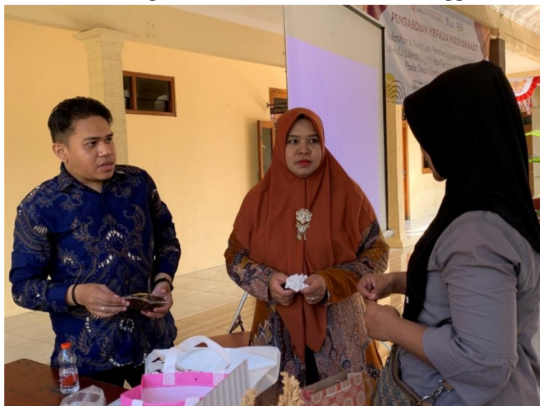
Gambar 6. Praktik Langsung Unggah Konten Promosi Ke Media Sosial

Hasil dari kegiatan menunjukkan adanya kemajuan yang jelas dalam aspek literasi digital bagi peserta. Secara kuantitatif :