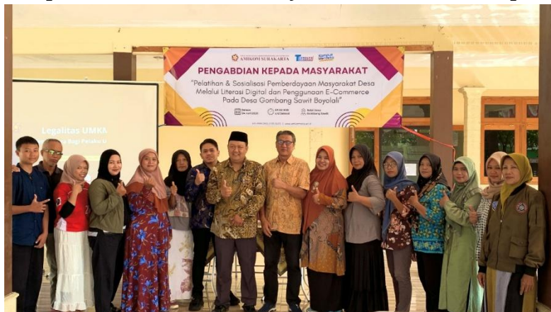
Gambar 2. Tim Pengabdian, Perangkat Desa dan Pelaku UMKM Sebelum Pelatihan Dimulai

hingga layanan. Sebelum pelatihan dimulai, dilakukan uji awal untuk menilai pemahaman peserta, dan setelah pelatihan, dilaksanakan uji akhir serta observasi praktik.