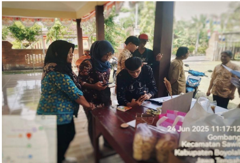
Gambar 5. Sesi Pelatihan Pengambilan Gambar Produk Menggunakan Kamera Ponsel