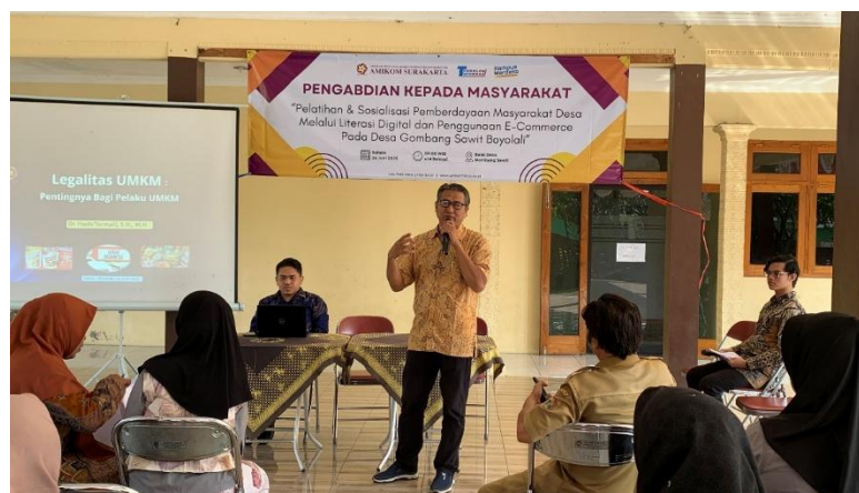
Gambar 3. Pengisian Materi oleh Tim Pengabdian Kepada Masyarakat